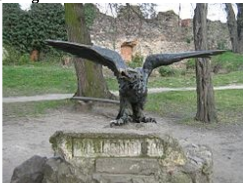
A várkertben található turulszobor