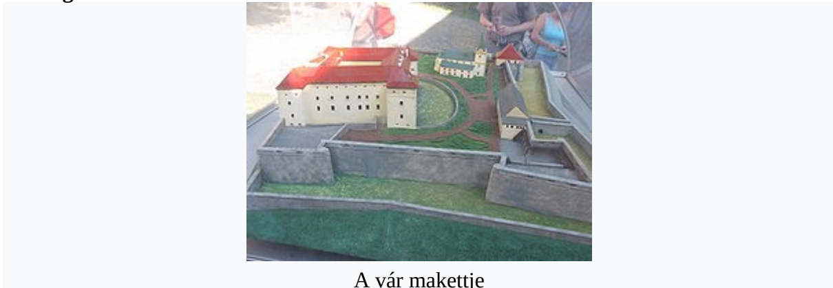
A vár makettje

Pontosan nem ismert, hogy mikor alakult ki Ung vármegye, A Pallas nagy lexikona szerint a 13. század elejéről való az Ung vármegyei főispán első említése. Központja eleinte Nagykapos volt, Ungvár csak járási székhely szerepét töltötte be. 1290-ben IV. (Kun) László Aba Amadé nádornak, az északkeleti Magyarország kiskirályának adományozta a vármegyét. Aba Amadé III. András híve volt, halála után Károly Róbertet támogatta. Azonban miután összetűzésbe került Kassavárosával, és a kassai polgárok, kiváltságaik védelmében, 1311-ben meggyilkolták, Károly Róbert a város és Aba Amadé fiai között kialakult konfliktusban a város mellé állt. Amadé fiai a király ellen fordultak, a rozgonyi csata azonban a király győzelmét hozta. Károly Róbert Ungvárt és környékét a vele együtt Nápolyból Magyarországra került Drugeth Fülöpnek adományozta, a rozgonyi csatában tanúsított vitézségéért. Ekkor vette kezdetét a Drugeth család több mint 360 éves uralma.